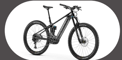
Mondraker Crafty R